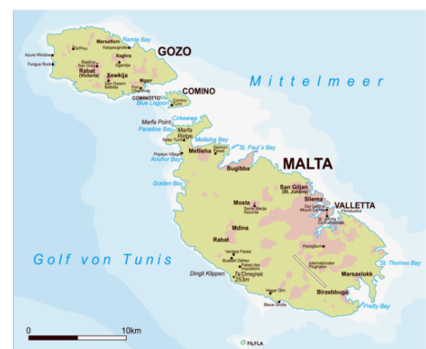
Abb. 1: Karte von Malta ( Wikipedia 2020 )

Malta, der kleine Felsbrocken im Mittelmeer (mit 316 Quadratkilometern noch kleiner als die Hälfte von Hamburg), hat durch seine Lage das Interesse von nahezu allen seefahrenden Nationen erregt: Phönizier, Römer, Goten und Byzantiner, Araber, Normannen und Staufer, Franzosen, Spanier - um nur einige zu nennen (und Inselherrschaften bis 1530 im chronologischen Schnelldurchlauf zu erwähnen). 1530 schenkte der spanische König dem aus Rhodos vertriebenen Johanniterorden Malta als ewigen Lehn - in der Hoffnung, dass der kleine Felsbrocken (nun voller Kreuzritter) Sizilien, das westliche Mittelmeer und die daran liegenden Länder vor dem osmanischen Heer beschützen würde. 1565 kam es dann zu der gefürchteten Schlacht - die als Große Belagerung ("the great siege") in die Geschichte einging. Die Johanniter hatten das osmanische Heer vertreiben können - und von allen europäischen Großmächten floss nun das Geld, um die Festungen auf Malta auszubauen, um einem erneuten Angriff besser Stand zu halten. Der Johanniterorden herrschte über Malta und florierte. In Saus und Braus lebend, immer weniger Angriffe der Osmanen fürchtend, kam der Orden immer mehr und mehr von seinen Tugenden ab und verfiel der Dekadenz. So war es