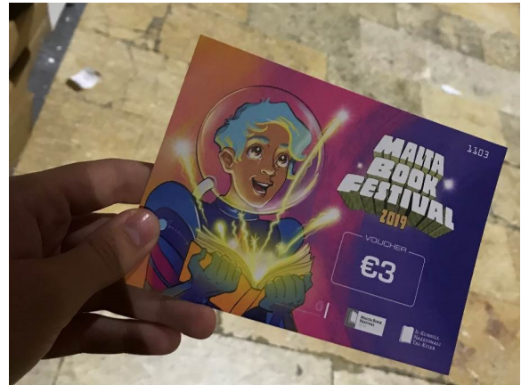
Abb. 2: Gutschein der Buchmesse für Kinder.

fast allen Ständen ließ sich mit diesem Gutschein ein Buch erwerben (meist zu Messepreisen, normalerweise kostet hier ein Kinderbuch circa 5€). Ich habe viele glückliche Kinder gesehen, die stolz ein (oder gleich mehrere) Bücher bezahlt hatten. Bücher, die sie sich alleine ausgesucht hatten. Ich bin von der Aktion der Messe begeistert.