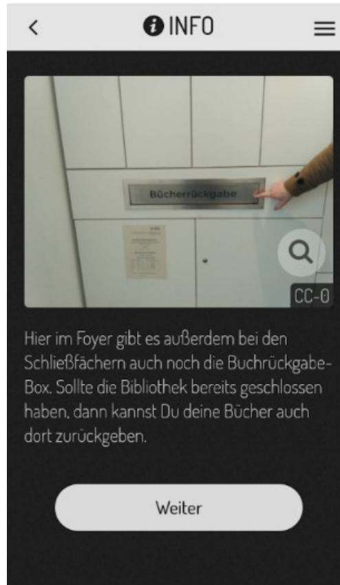
Abb. 2 Beispiel für eine Information (Actionbound 2020).