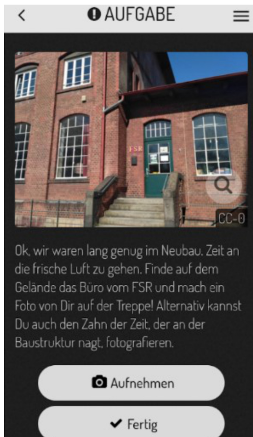
Abb. 3 Beispiel für eine Aufgabe (Actionbound 2020).

Übernahme der Kosten durch das Budget der OE-Woche. Nachdem wir in ihrer Sprechstunde unser Konzept vorgestellt haben und die wichtigsten Informationen zur App zusammengefasst haben, bekamen wir die Zusicherung, dass die Kosten übernommen werden.