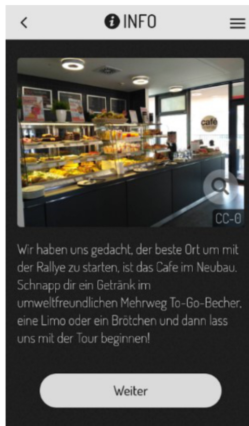
Abb. 1 Beginn der Campus-Tour (Actionbound 2020).

Über das Chipkartenbüro in der Stiftstraße 69 gelangen die Teilnehmer*innen in das Gebäude B des Campus Berliner Tor. Hier lösen sie eine Aufgabe im Campus-Shop. Wieder draußen stehen das Fitnessstudio und der Copy Shop auf der Liste.