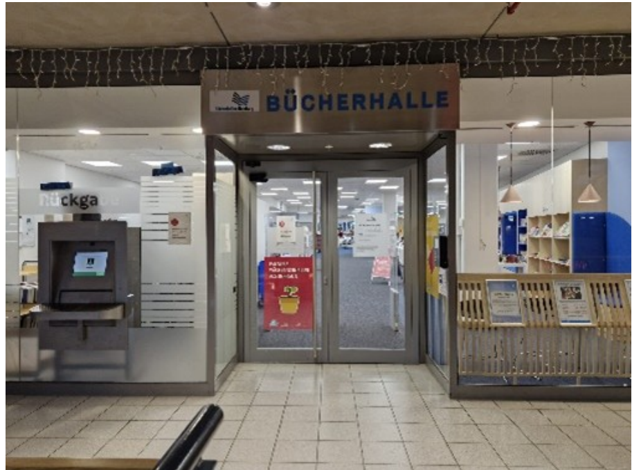
Abb. 1: Automatische Eingangstür der Bücherhalle Altona

Das Angebot kann genutzt werden von allen Personen, die über 18 Jahre alt sind und eine gültige Bücherhallen-Karte haben. Minderjährige dürfen die Bücherhalle also nicht unbeaufsichtigt betreten während der „FlexiBib“-Zeiten. Um in die geschlossene Bücherhalle zu gelangen, müssen Nutzende einfach ihre gültige Bücherhallen-Karte an das dafür vorgesehene Kartenlesegerät halten, wodurch sich die automatische Tür öffnet ( Bücherhallen Hamburg o.D.-a ; Bücherhallen Hamburg o.D.-b ).