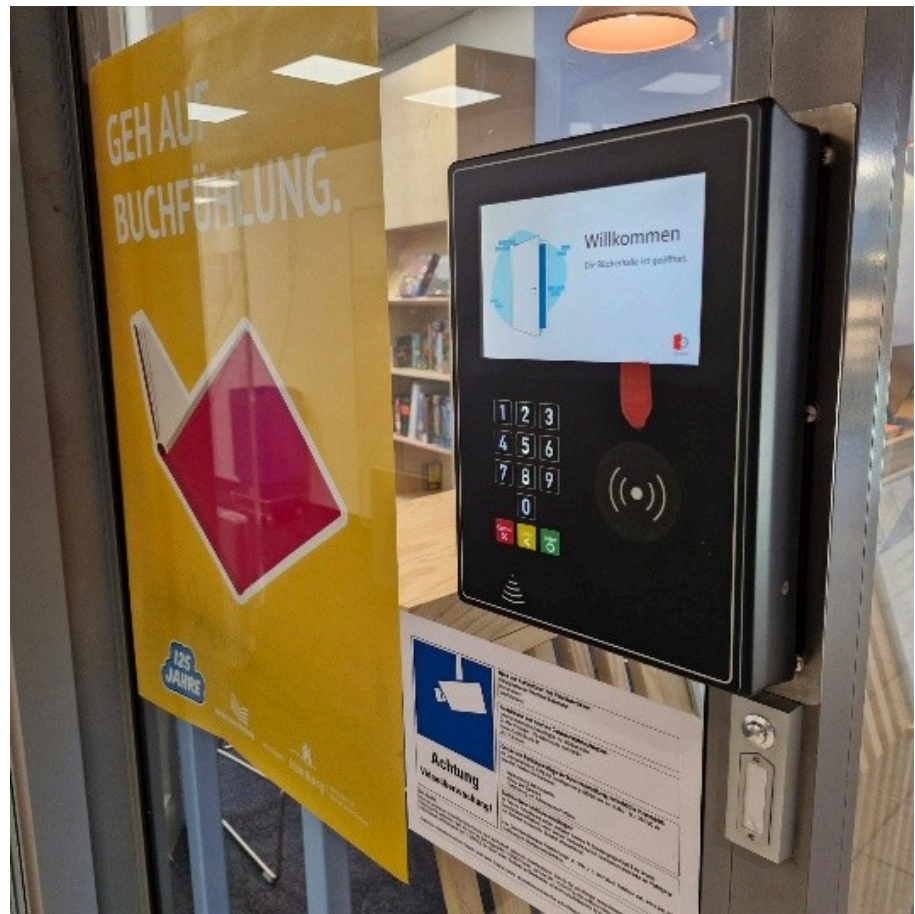
Abb. 2: Kartenlesegerät zum Öffnen der Tür in der „FlexiBib“-Zeit

wachung für Sicherheit. Die Aufnahmen werden nach 72 Stunden wieder gelöscht ( Bücherhallen Hamburg o.D.-a ).