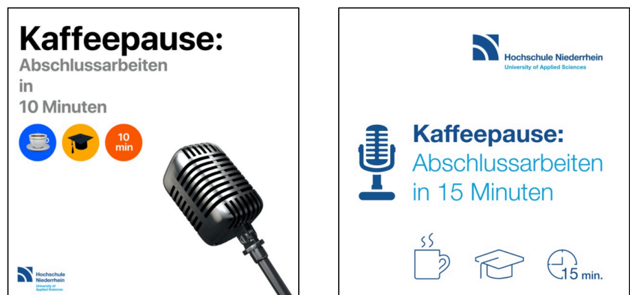
Abbildung 2: Entwicklung des Podcast-Logos.

Aus der Evaluation lassen sich bereits bedeutsame Aspekte für die Konzeption der Integration einer Podcast-Produktion in eine Lehrveranstaltung ablesen. Lernziele sind für Studierende immer von besonderer Bedeutung, lassen sich hieraus doch die Beurteilungskriterien für Prüfungsleistungen ablesen. Die Einbettung von anwendungsbezogenen Beispielen sorgte für eine hohe Anschaulichkeit. So wurden beispielsweise bestehende Podcast-Angebote betrachtet und grob analysiert. Manchmal hat dies sogar zu einer Steigerung des Interesses an Podcasts geführt.