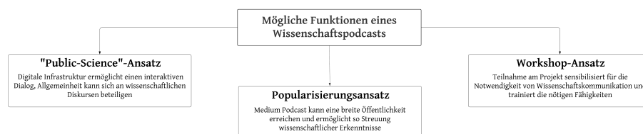
Abbildung 1: Mögliche Ansätze bei der Ausgestaltung eines Wissenschaftspodcasts.

Als Basis unserer Projektreflexion nehmen wir im Folgenden eine systematische Unterscheidung von drei möglichen Ansätzen der Wissenschaftskommunikation vor, die in einem Wissenschaftspodcast verfolgt werden können. Den bewährten Konzepten Wissenschaftspopularisierung und Public Science fügen wir einen dritten Ansatz hinzu, der weniger auf Öffentlichkeitswirksamkeit, sondern vielmehr auf die Übung von Nachwuchswissenschaftler:innen als Kommunikator:innen abzielt (Abb. 1).