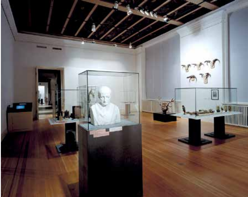
Abb. 2: Die ruhige Präsentationsform der Ausstellung »Theatrum Naturae et Artis« (2000) hob den Schauwert der Objekte hervor. [Installation shot Theatrum].

sitärer Sammlungen nicht hervorgehoben wurden. Die Bezugnahme auf einen gemeinsamen Ursprung in der Kunstkammer und die Schaffung eines Gesamtbildes heterogener Objekte verstellte mitunter den Blick auf die Heterogenität der unterschiedlichen fachlichen und zeitlich veränderlichen Praktiken im Umgang mit den Objekten. Die Frage blieb offen, wie sich die Kunstkammer als barockes Sammelmodell in eine Gegenwart überführen lässt, in der Sammlungen zwischenzeitlich eine mehrere Jahrhunderte währende fachspezifische Ausprägung erfahren haben.