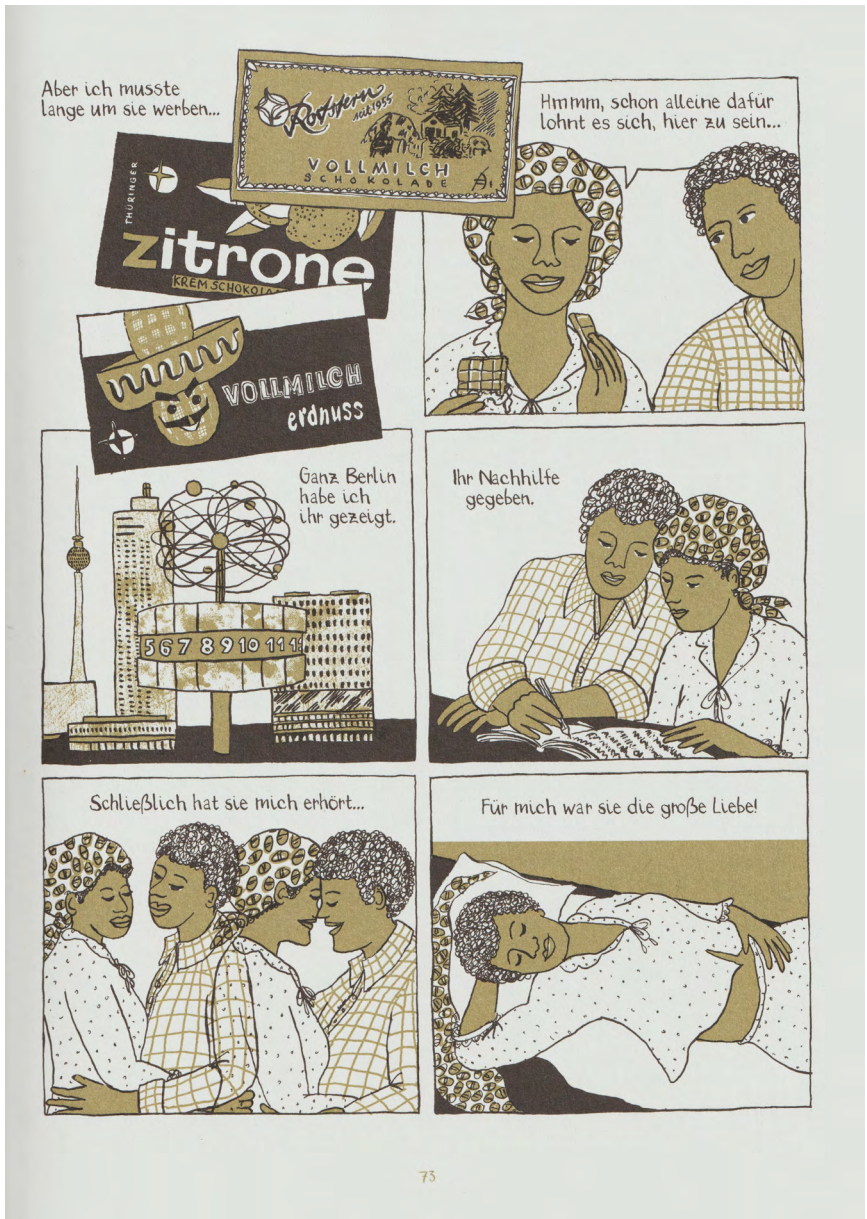
Abb. 3.2: Illustration aus der Graphic Novel „Madgermanes“ S. 73 (© Birgit Weyhe/avant-verlag)