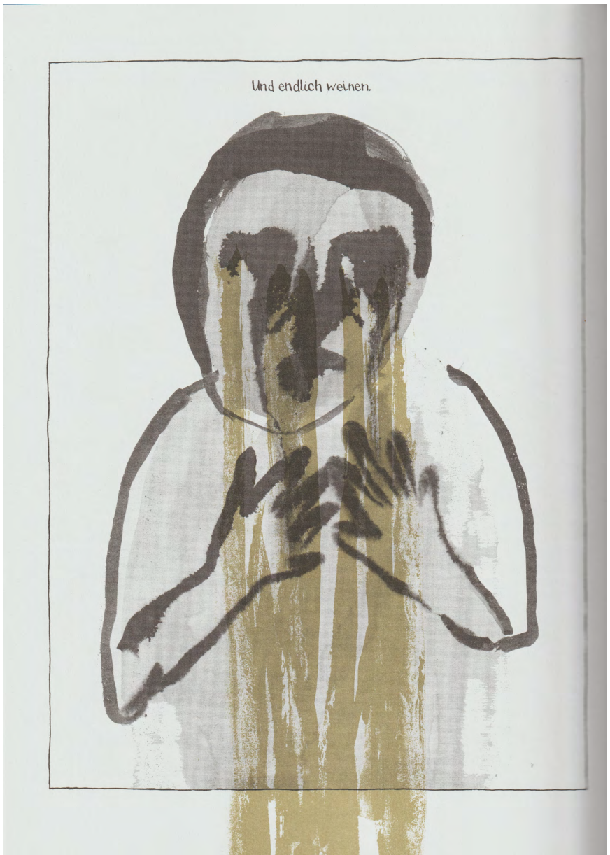
Abb. 4.2: Illustration aus der Graphic Novel „Madgermanes“ S. 202 (© Birgit Weyhe/avant-verlag)