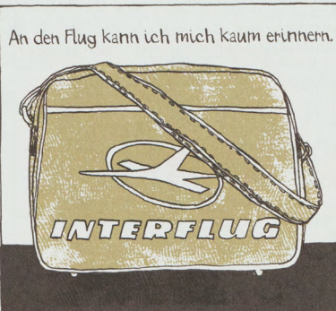
Abb. 3.1: Illustration aus der Graphic Novel „Madgermanes“ S. 25 (© Birgit Weyhe/Avant-Verlag)