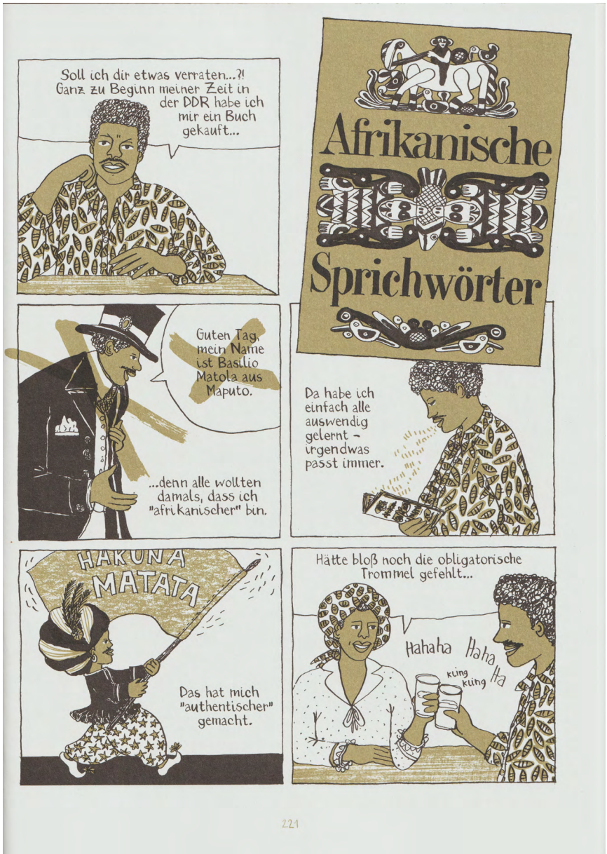
Abb. 6: Illustration aus der Graphic Novel „Madgermanes“ S. 221 (© Birgit Weyhe/Avant-Verlag)