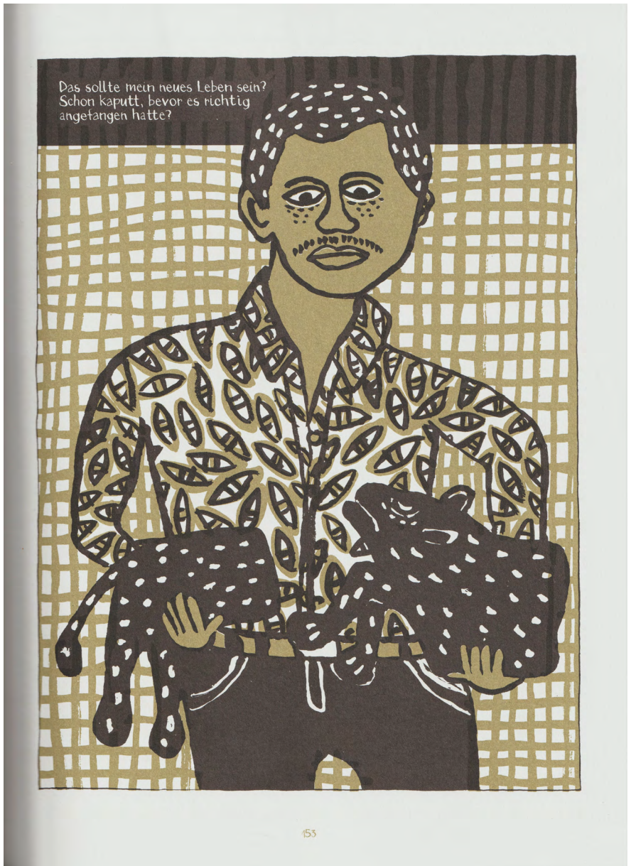
Abb. 5: Illustration aus der Graphic Novel „Madgermanes“ S. 153 (© Birgit Weyhe/Avant-Verlag)