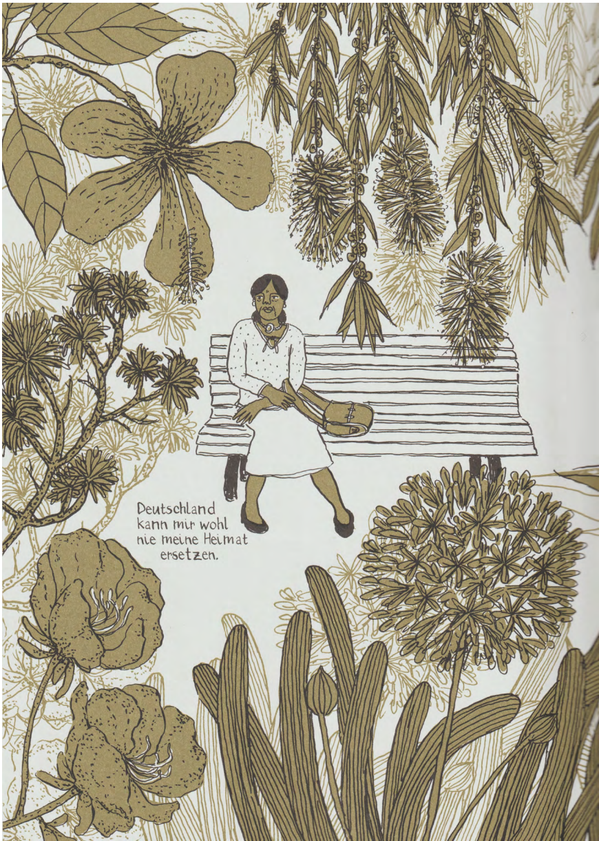
Abb. 2.2: Illustration aus der Graphic Novel „Madgermanes“ S. 10 (© Birgit Weyhe/Avant-Verlag)