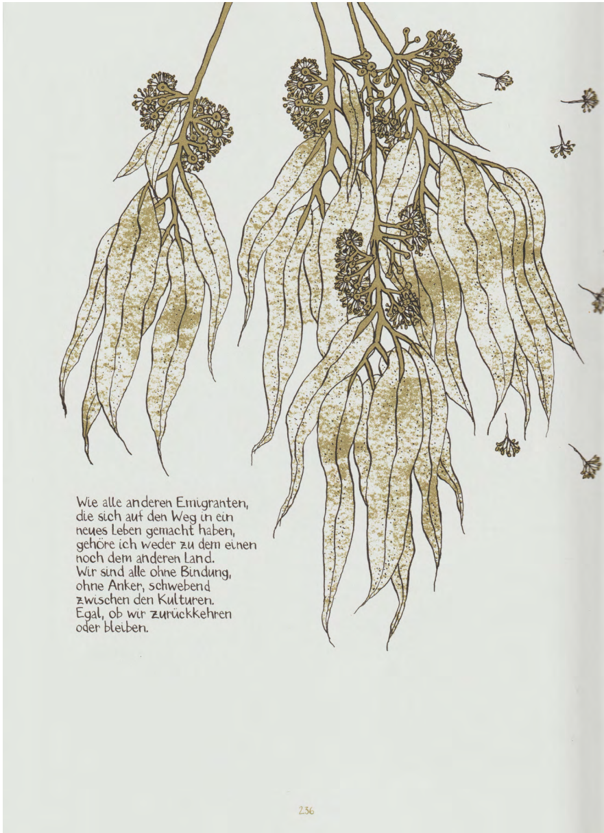
Abb. 7: Illustration aus der Graphic Novel „Madgermanes“ S. 236 (© Birgit Weyhe/Avant-Verlag).