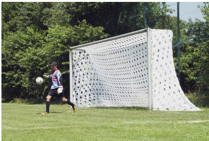
Abb. 6: How to remember sport is about fun: Homesick. Design: Silvia Knüppel/Damien Regamey. Jahr: 2004/2006, © Silvia Knüppel/Damien Regamey