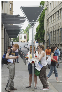
Abb. 1: How to enjoy StVO: City Rooming – tables. Design: Silvia Knüppel/Moritz Willborn. Jahr: 2006, © Silvia Knüppel/Moritz Willborn