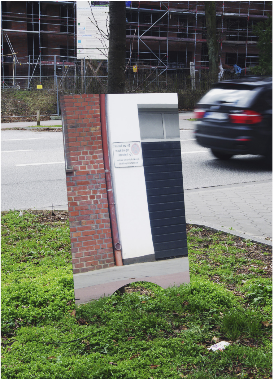
Abb. 3: How to start change: 1.Wahl. Design: Silvia Knüppel. Jahr: 2014, ©Silvia Knüppel