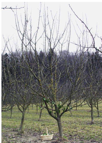
Abb. 4: How to avoid winter depression: Sommer im Winter. Design: Silvia Knüppel/ Isabell Anhalt. Jahr: 2007, ©Silvia Knüppel/ Isabell Anhalt