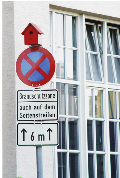
Abb. 2: How to expand street sign life: City Rooming – bird house. Design: Silvia Knüppel/Moritz Willborn. Jahr: 2006