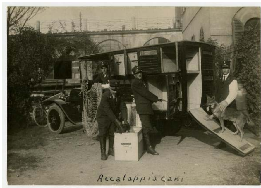
1 | Milano - Canile Municipale - Vettura del servizio accalappiacani - Quattro addetti del servizio accalappiacani ed alcuni cani, prima metà XX 3

I cani venivano catturati con l'uso di una trappola a retino oppure di un accalappiacani rigido (fig. 1), successivamente venivano rinchiusi nel veicolo adibito al trasporto. Lo stress provocato dalla cattura, il numero dei cani trasportati facevano sì che l'attività di accalappiatori si svolgesse dinanzi a una folla di curiosi attirati dall'ululato dei cani catturati.