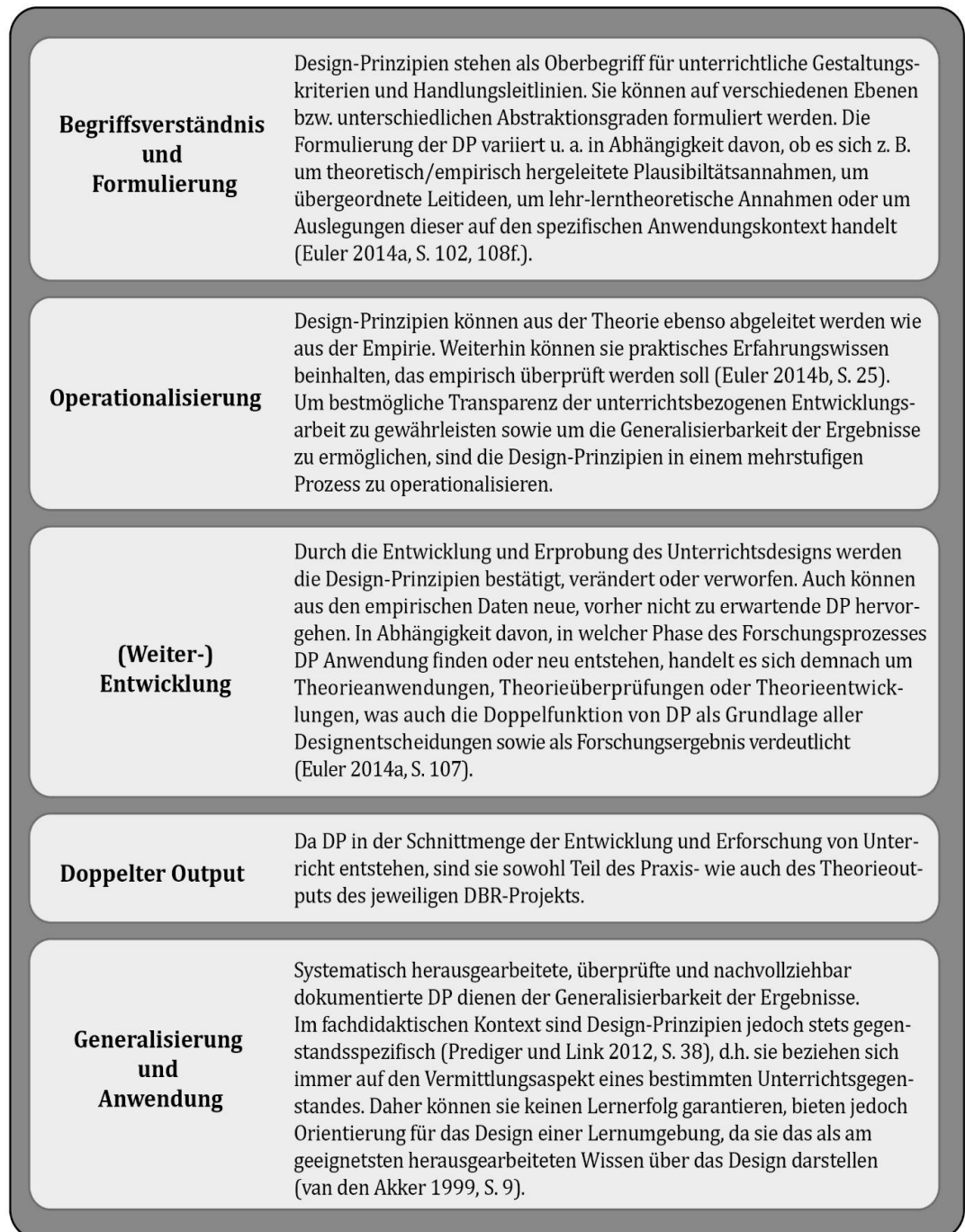
Abbildung 6: Charakteristika von Design-Prinzipien (eigene Darstellung)

Im Folgenden wird das für die Geographiedidaktik vorgeschlagene Vorgehen der Operationalisierung der DP beschrieben. Dabei ist zunächst zu betonen, dass die Formulierung von und der Umgang mit DP in Anlehnung an die von Euler (2014a, S. 107) vorgeschlagene Grundstruktur erfolgt. Bei den weiteren (neu entwickelten) Operationalisierungsstufen liegt der Fokus auf der unterrichtspraktischen Konkretisierung des Designs.